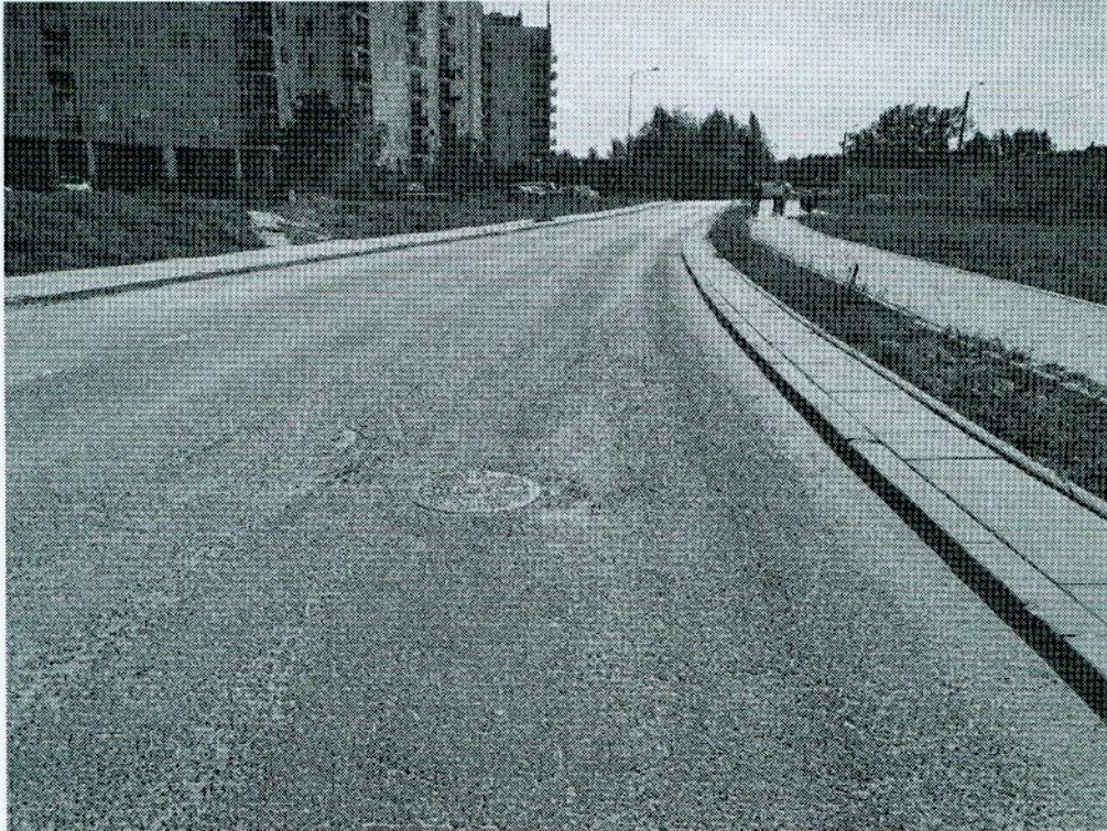
15) udostępnienie parkingów wzdłuż ul. Płaskowickiej przy osiedlu Kazury.

Prosimy ww. adresatów o porozumienie się i działanie na rzecz mieszkańców, bo to powinno być celem istnienia tych organów i jednostek, oraz o niespychanie odpowiedzialności na kogoś innego. Jesteśmy zdegustowani przebiegiem współpracy na linii m.st. Warszawa – Skarb Państwa i konsekwencjami, które ponoszą za to mieszkańcy tej okolicy.