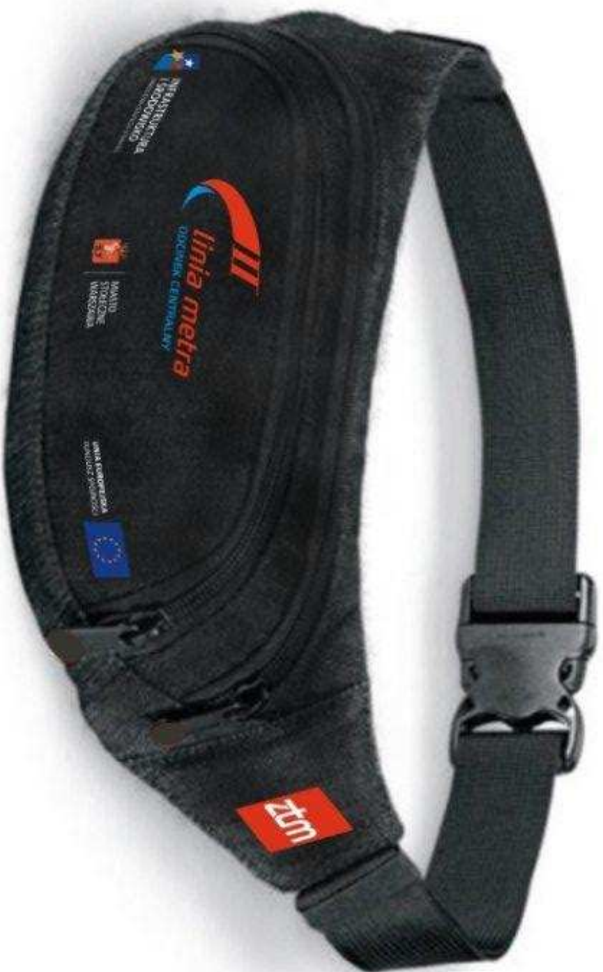
Saszetka (nerka) na pasek