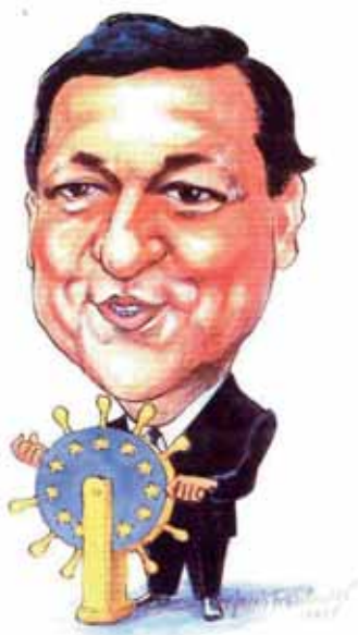
Jacek Frankowski José Manuel Barroso

zania, wspólne strategie działań oraz rekomendacje polityczne dotyczące zarządzania i rozwoju transportu publicznego - do zastosowania na szczeblu regionalnym, narodowym i Unii Europejskiej. Zdefiniowane w Księdze zalecenia dotyczą obszarów, w których uczestnicy projektu wymieniali się wiedzą i doświadczeniami – wzmocnienie zarządów zintegrowanych systemów transportu publicznego, zrównoważone finansowanie transportu publicznego, umowy i przetargi na usługi komunikacyjne, działania proekologiczne, plany mobilności i zarządzanie ruchem, zintegrowana